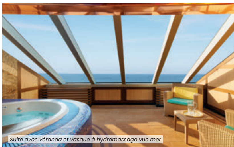
Suite avec véranda et vasque à hydromassage vue mer