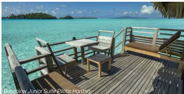
Bungalow Junior Suite Pilotis Horizon