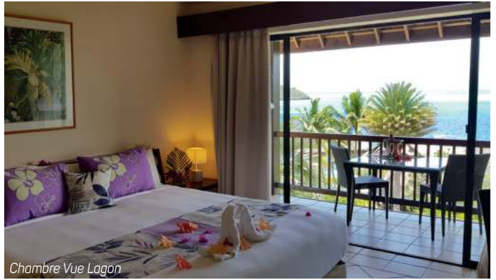
Chambre Vue Lagon