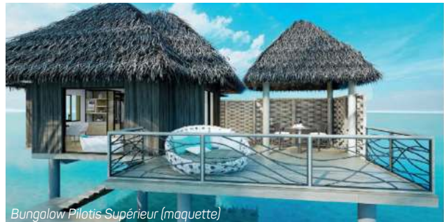
Bungalow Pilotis Supérieur (maquette)