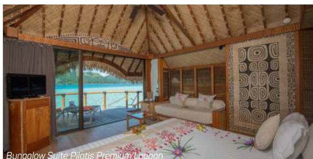
Bungalow Suite Pilotis Premium Lagoon