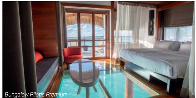
Bungalow Pilotis Premium