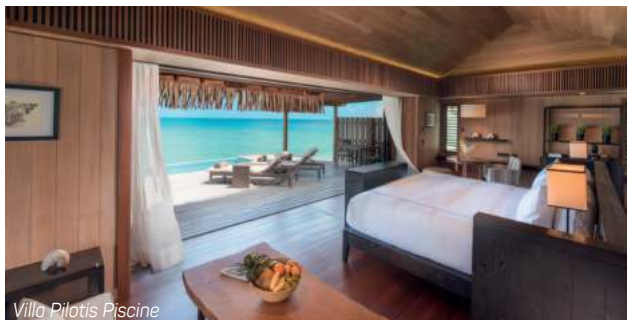
Villa Pilatis Piscine