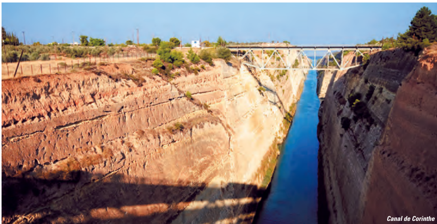
Canal de Corinthe

Débarquement après le petit déjeuner. Transfert en ville d'Athènes et temps libre, puis transfert à l'aéroport et envol pour la Suisse.