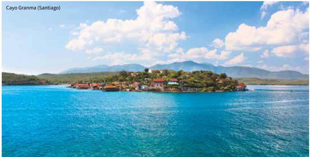
Cayo Granma (Santiago)

11 e jour : Excursion «Gibara Autrement» (avec guide francophone privé – repas de midi inclus), puis Gibara – Bayamo (110km) Rencontre avec le guide à votre logement. Excursion dans la grotte de Los Panaderos avec un guide spéléologue. Repas dans un restaurant, puis parcours panoramique de la ville. Visite à pied des principales rues et du Malecon, ainsi que du Musée des Sciences Naturelles. Ensuite, en route vers Bayamo, berceau culturel et historique de Cuba, en traversant la ville de Holguin. Accueil par notre représentant et installation pour 1 nuit, petit-déjeuner inclus.