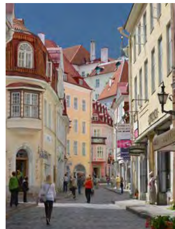
Flânez dans les ruelles historiques de Tallinn.

*Dates spéciales à St-Pétersbourg: 03-07.06/12-21.06 et 19-26.07 Tous les prix sont sur demande.