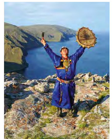
Découverte du pays des Bouriates, paradis du chamanisme sibérien.