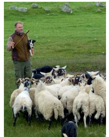
Observez comment les chiens de berger obéissent aux instructions.