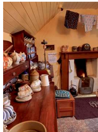
Les maisons traditionnelles des îles donnent un bon aperçu de la vie à l'époque.