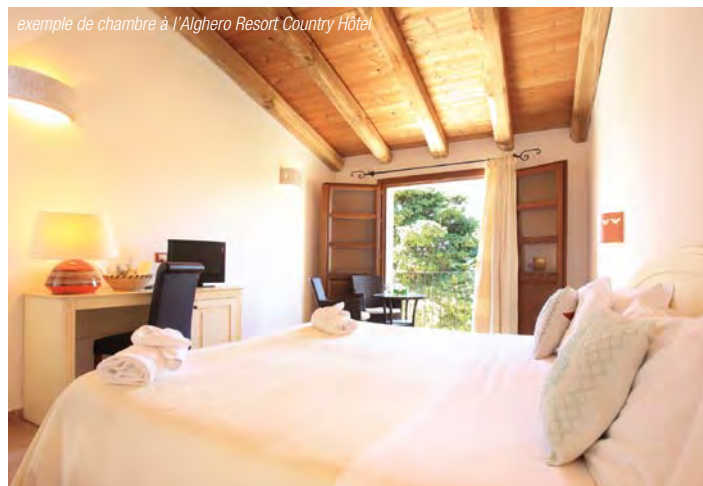
exemple de chambre à l'Alghero Resort Country Hôtel