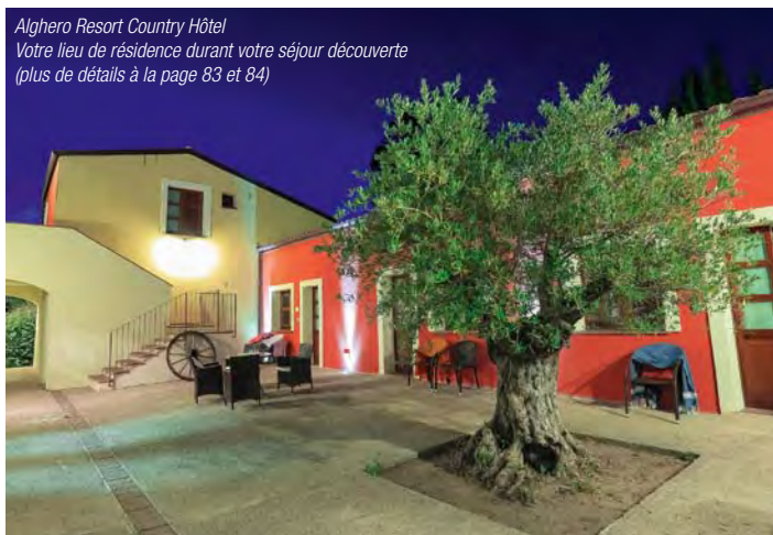
Alghero Resort Country Hôtel Votre lieu de résidence durant votre séjour découverte (plus de détails à la page 83 et 84)