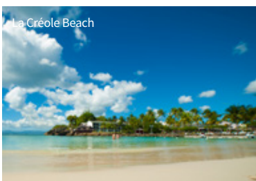
La Créole Beach