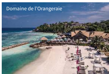
Domaine de l'Orangerie