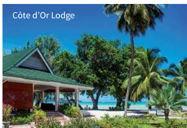
Côte d'Or Lodge